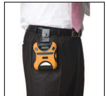
Clip para correa incluido